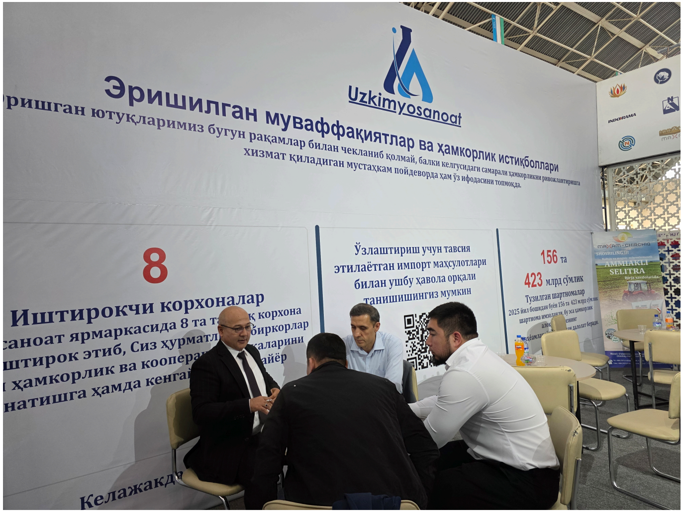
"Ўзкимёсаноат" АЖ Матбуот хизмати