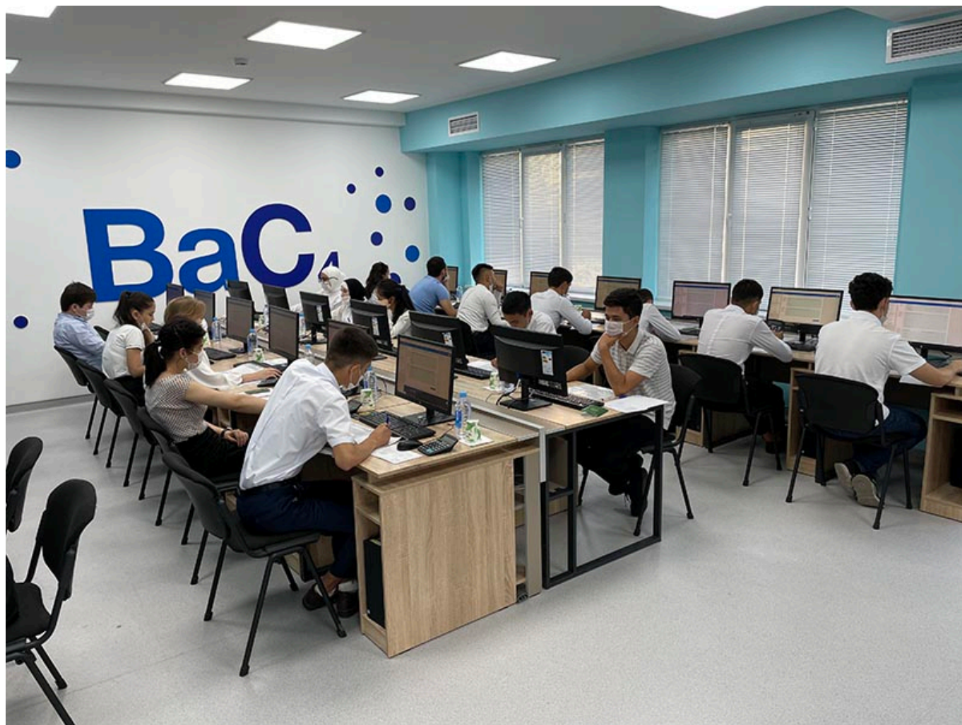
"Ўзкимёсаноат" АЖ Матбуот хизмати