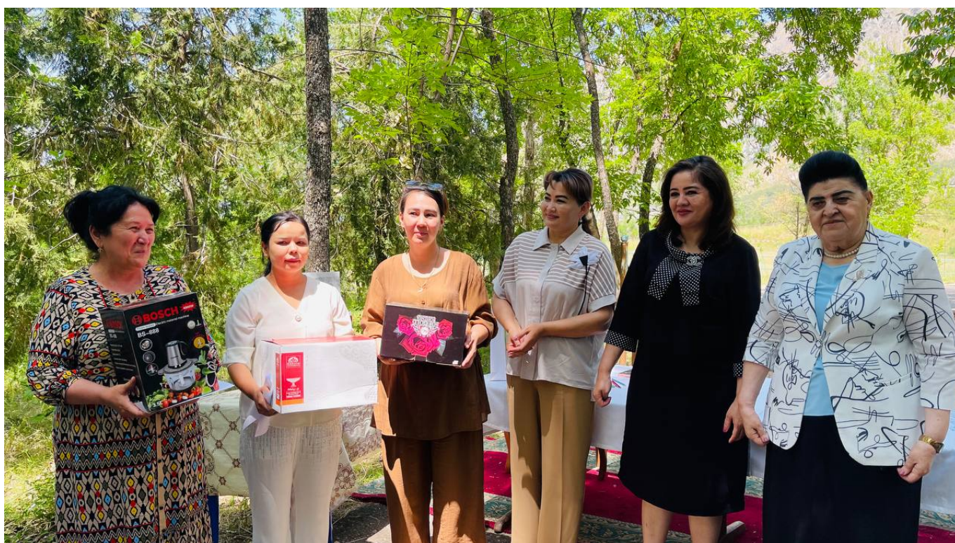
«Аммофос-Максам» АЖ Ахборот хизмати