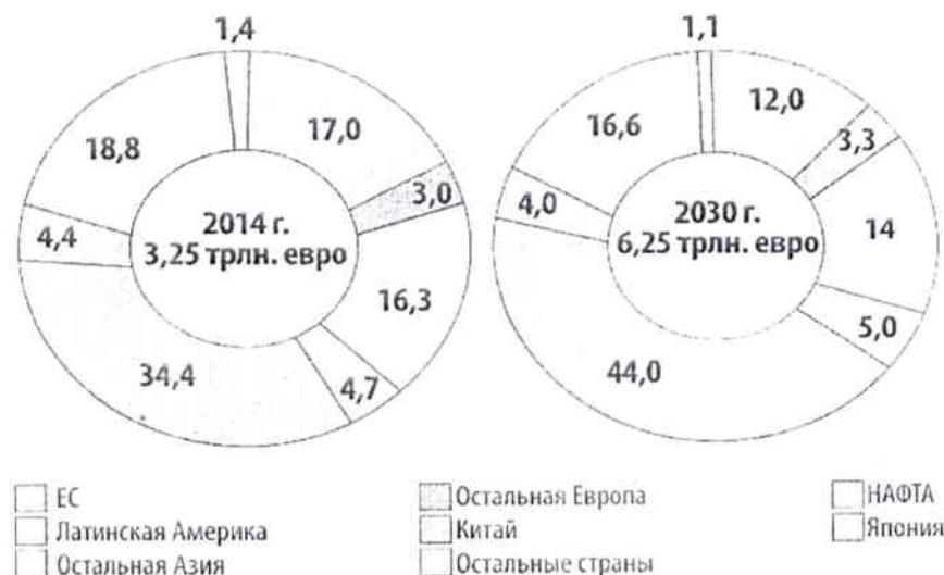
Рис.4. Структура производства химической и нефтехимической продукции по странам и регионам мира, %

6. Расширение производственного потенциала химической промышленности Китая, стран Ближнего Востока и Юго-Западной Азии существенным образом меняет позиции этих стран на мировом рынке химической и нефтехимической продукции и обостряет конкурентную борьбу за покупателя.