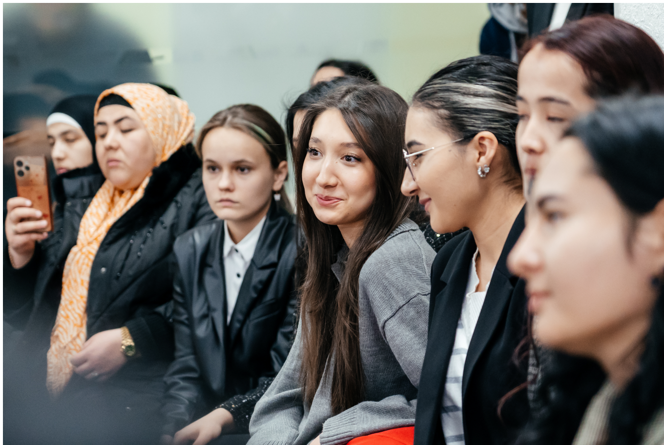
Пресс-служба АО «Узкимёаноат»