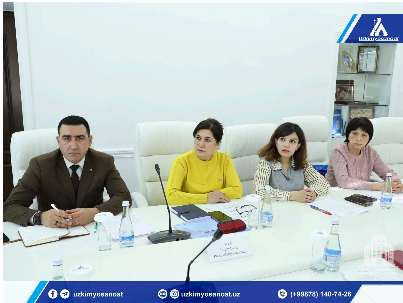
"O'zkimyosanoat" AJ Matbuot xizmati