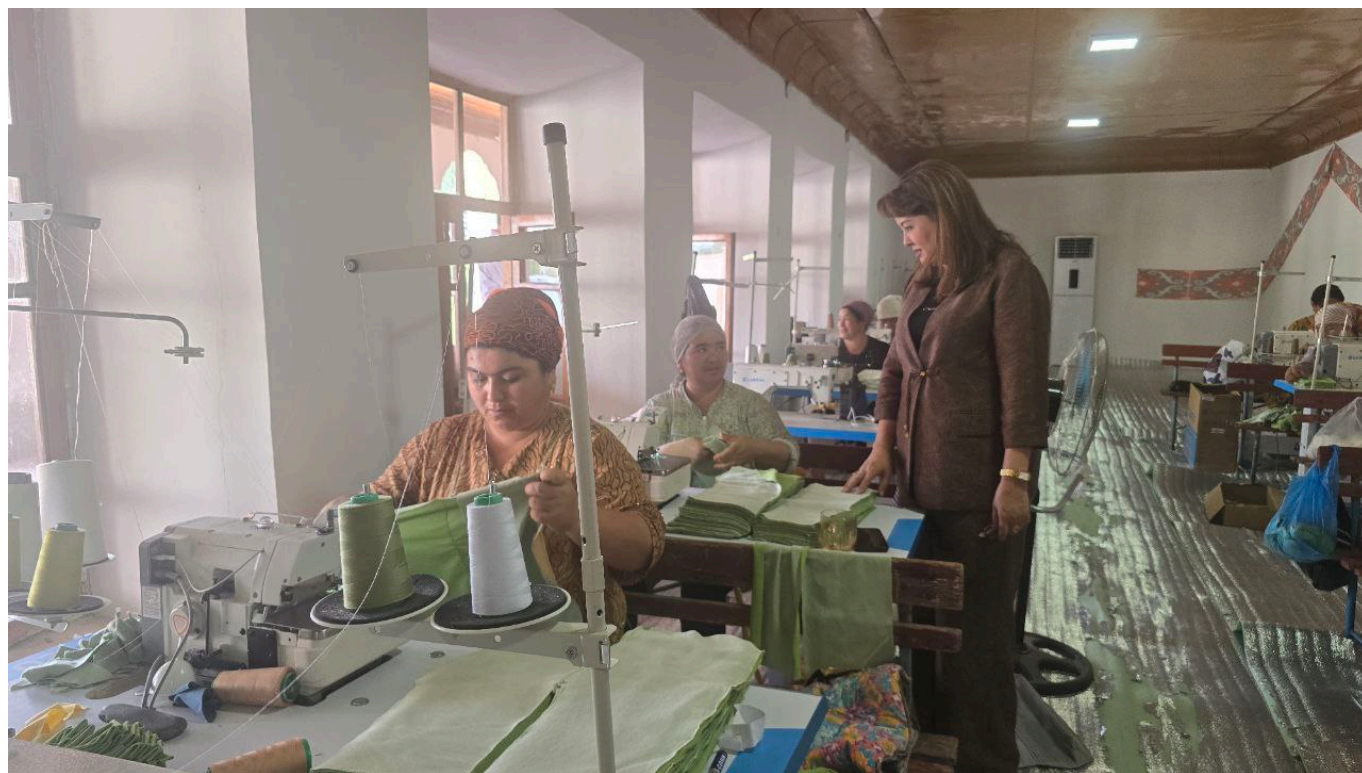
"O'zkimyosanoat" AJ Matbuot xizmati