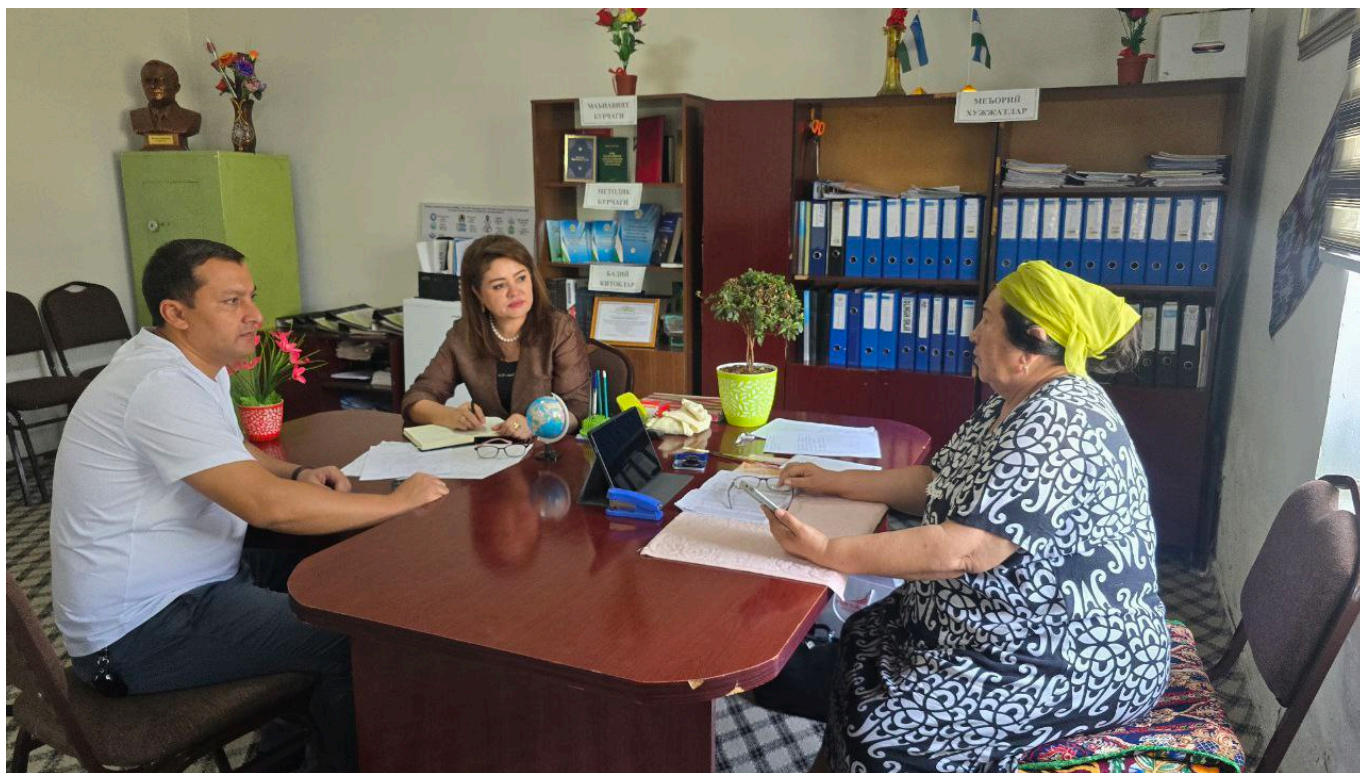
"O'zkimyosanoat" AJ mazkur hududlarda amalga oshirilayotgan islohotlarni yanada samarali va tizimli tashkil etishda hamkorlikni davom ettiradi.