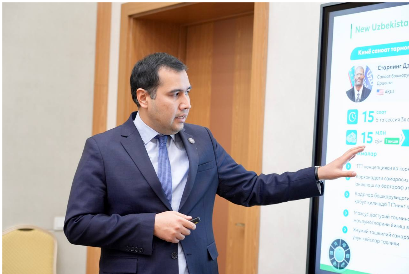
"O'zkimyosanoat" AJ Matbuot xizmati