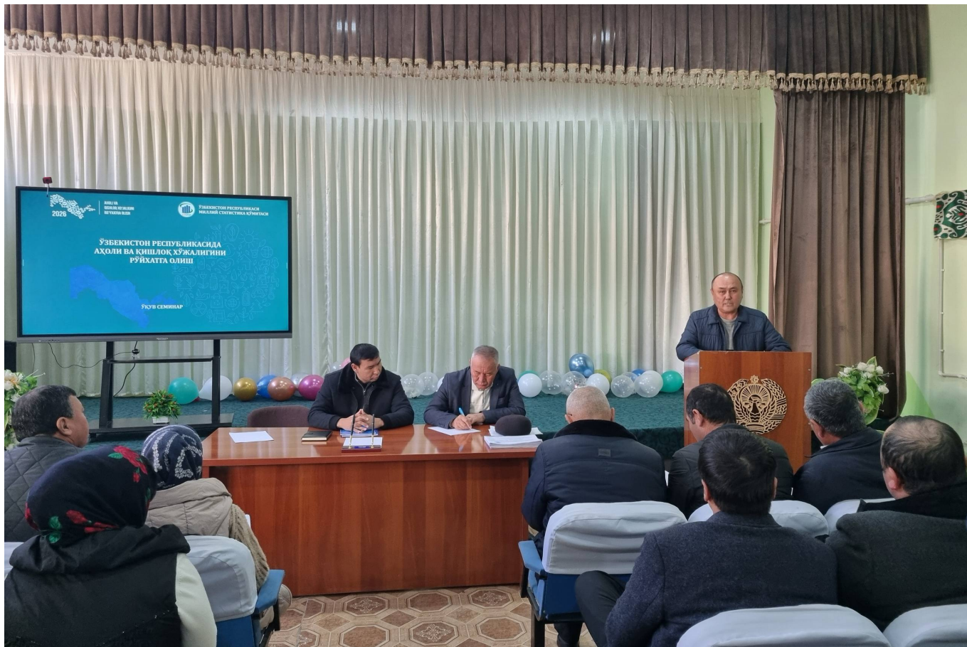
Xususan, Dehqonobod tumanidagi "Istiqlol" MFY hududida joylashgan 70-sonli umumta'lim maktabida maktab direktorlari, ularning o'rinbosarlari hamda pedagog xodimlar ishtirokida amaliy o'quv seminari va tushuntirish ishlari o'tkazildi.